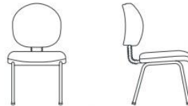
Executiva fixa 4 pés