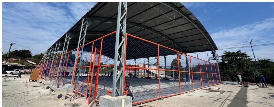
Unidades escolares, praça e pista de caminhada serão inauguradas.

Para fechar a semana com chave de ouro, a Prefeitura de Queimados inaugura a Praça Carlos Henrique de Paula Niberring, no bairro Belmonte, às 19h. A praça está com pavimentação em intertravado, playground, amarelinha, academia da terceira idade, mesas de jogos, bancos de concreto, quadra poliesportiva com voleibol, basquete e futebol, iluminação em LED, paisagismo e acessibilidade.