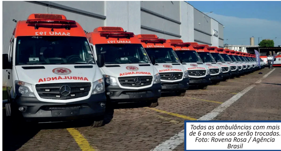
Todas as ambulâncias com mais de 6 anos de uso serão trocadas.

Lula destacou que a entrega faz parte da renovação de frota, que deve contar ainda com mais 1.780 ambulâncias. “Como você pode imaginar ficar 10 anos sem renovar a frota do Samu? Porque uma ambulância tem que estar bem de manutenção, ela tem que estar boa. A hora que ligar o motor, ela tem que pegar”, disse, em evento na cidade de Salto, interior de São Paulo, na unidade responsável pela fabricação dos veículos especiais.