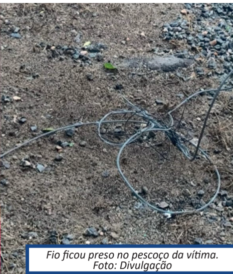
Fio ficou preso no pescoço da vítima.

Ainda conforme Matheus, o socorro já havia sido acionado, mas a demora era grande. Por esse motivo, eles colocaram o corpo de Max no carro e o levaram para a unidade de saúde, mas ele não conseguiu resistir aos ferimentos.