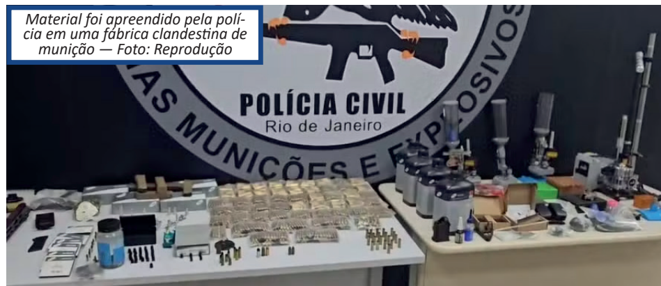
Material foi apreendido pela polícia em uma fábrica clandestina de munição

A polícia também vai investigar se a fábrica era responsável por fazer a manutenção das armas usadas pelo tráfico durante os confrontos com criminosos rivais. Carlos Renato Fernandes Freitas, o Renatinho, suspeito de ser o responsável pela fabricação da munição, foi preso em flagrante. Ele vai ser autuado na Desarme por crime de posse de munição de calibre restrito