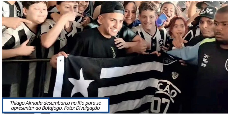
Thiago Almada desembarca no Rio para se apresentar ao Botafogo.

Apesar do horário, cerca de 40 torcedores estavam no local para receber e fazer festa pela jogador. Almada não quis conversar com a imprensa e só cumprimentou a torcida antes de entrar no carro e rumar às instalações do clube.