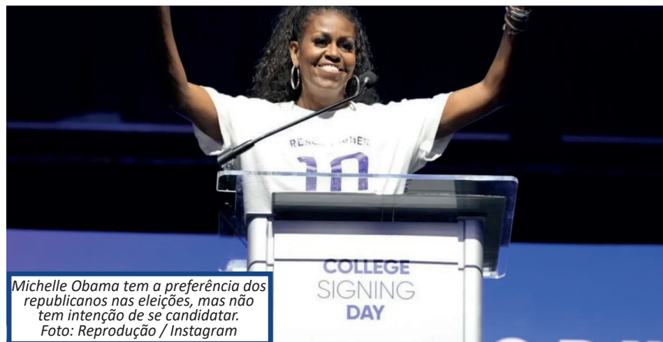
Michelle Obama tem a preferência dos republicanos nas eleições, mas não tem intenção de se candidatar.

todo, não conseguiu contrapor os argumentos do adversário e pareceu perdido durante o embate. Em janeiro, a Reuters/Ipsos já havia indicado dúvidas entre os democratas sobre a candidatura de Biden. Na época, a disputa pela nomeação do partido ainda estava em andamento e 49% dos eleitores foram contra a indicação do presidente para as eleições de 2024. Além de Michelle Obama, a vice-presidente Kamala Harris e o atual governador da Califórnia, Gavin Newsom, surgem como postulantes a vaga democrata no pleito, caso Biden opte por deixar na disputa. No entanto, ambos aparecem abaixo da ex-primeira-dama nos embates diretos com o candidato republicano.