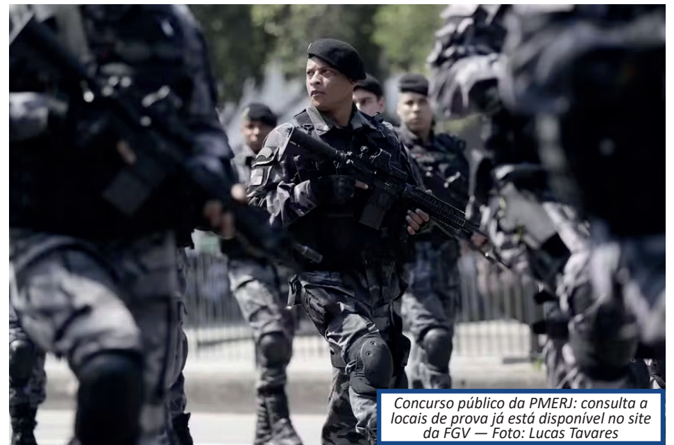
Concurso público da PMERJ: consulta a locais de prova já está disponível no site da FGV

tes que fundamentem a tese, progressão temática coerente, propriedade vocabular, clareza, apropriação produtiva e autoral do recorte temático CONCURSO PMERJ TEVE MAIS DE 117 MIL INSCRITOS